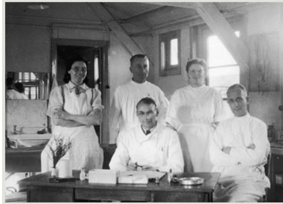
Artsen in het ziekenhuis van Kamp Westerbork

De 'fatsoenlijke' behandeling door de nazi's was een illusie. Het stelsel van vrijstellingen, het ziekenhuis en het cabaret hadden geen ander doel dan de bewoners rustig te houden. Maar uiteindelijk moest bijna iedereen op transport. Het systeem gaf uiteindelijk dus alleen valse hoop. In de link hierna krijgt u een beeld van de ziekenzorg in Westerbork.