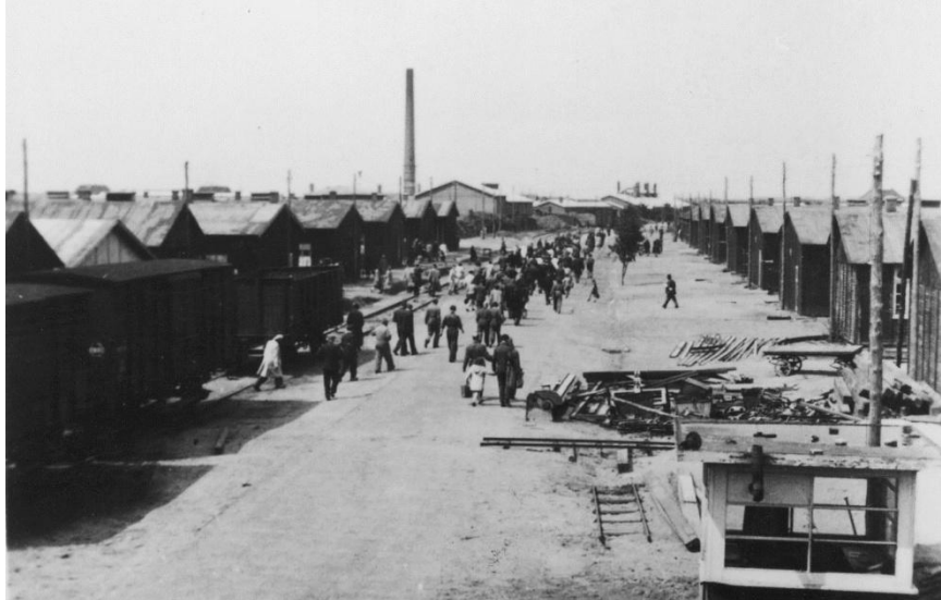
De hoofdstraat van Kamp Westerbork