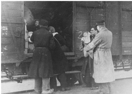
Transport vanaf Westerbork de trein ze in 1944 werd vergast.

In het kamp was alles zo geregeld om de Joden het idee te geven dat ze naar werkkampen in Oost-Europa zou worden gestuurd. Het leven zou er zwaar, hard en eentonig zijn, maar ze zouden in ieder geval kunnen leven. Er ontstond wel twijfel als er treinen vertrokken met alleen ouderen, zieken of kinderen. Er was een permanente angst om gedeporteerd te worden. Een voortdurend besef van een naderend onheil. Dat verklaart de wanhopige pogingen om aan de deportaties te ontsnappen, bijvoorbeeld door een van de baantjes aan te nemen.