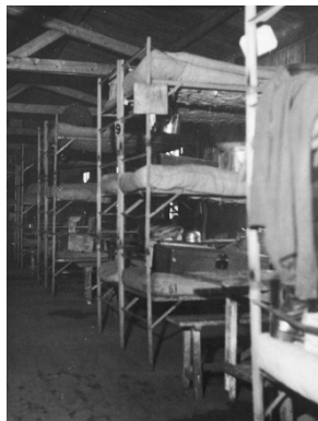
Een barak in kamp Westerbork

In deze nieuwe omgeving moesten Roosje, en haar moeder overleven. De barakken zijn vies en de bedden zijn slechts ijzeren hoogslapers zonder beddengoed. Het eten bestaat vaak uit slappe koffie en stampotten. Deze kleine maaltijden waren niet voldoende om op krachten te blijven en al helemaal niet als je als gevangene werk moest verrichten.